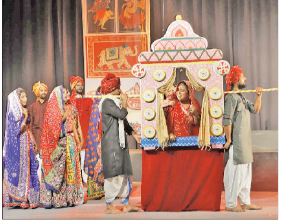
रोहतक। सांस्कृतिक कार्यक्रम प्रस्तुत करते प्रतिभागी, दादा लख्मी चंद स्टेट यूनिवर्सिटी ऑफ परफॉर्मिंग एंड विजुअल आर्ट्स में मौजूद मुख्य अतिथि, कुलपति व विद्यार्थी तथा नाटक प्रस्तुत करते कलाकार।