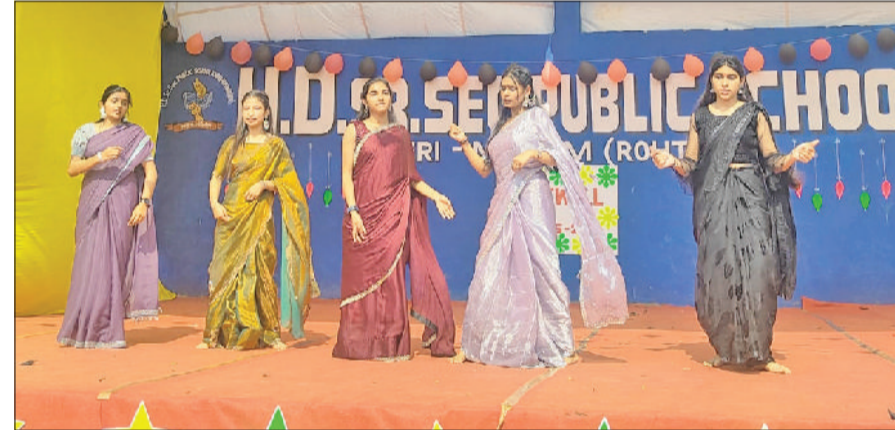
महम। विदाई समारोह में नृत्य करती एचडी स्कूल खेड़ी महम की छात्राएं।

खेड़ी महम स्थित एचडी सोनियर सेकेंडरी स्कूल में कक्षा 12वीं के विद्यार्थियों के सम्मान में विदाई समारोह का आयोजन किया गया। कार्यक्रम की शुरुआत माँ सरस्वती के समक्ष दीप प्रज्वलन के साथ की गई। समारोह में विद्यालय प्रबंधन, शिक्षकगण एवं छात्र-छात्राएं बड़ी संख्या में उपस्थित रहे। विद्यार्थियों द्वारा रंगारंग सांस्कृतिक कार्यक्रम प्रस्तुत किए गए, जिनमें गीत, नृत्य और प्रेरणादायक प्रस्तुतियां शामिल रहीं। कार्यक्रम के दौरान विद्यार्थियों ने विद्यालय में बिताए अनुभव सांझा